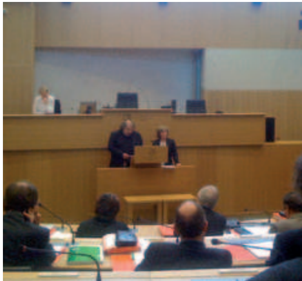
« Défendre les travailleurs de l'Enseignement supérieur et l'Enseignement officiel. Ce qui ne signifie pas réclamer le statu quo. »

sions (aide à la réussite, formation continuée, ...) et tout financement préférentiel (coefficient plus favorable pour les étudiants boursiers, de condition modeste) fassent l'objet d'un fi-